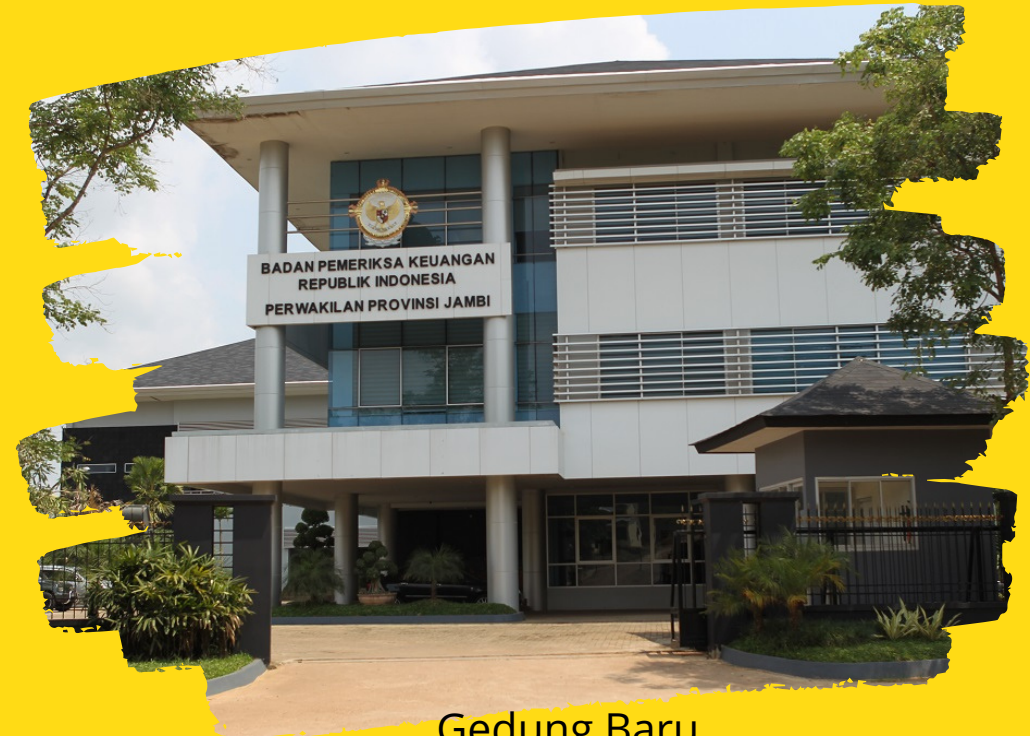
Gedung Baru Jl. Pangeran Hidayat KM 6,5 No. 65 Kecamatan Kotabaru Kelurahan Sukakarya, Jambi