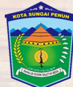
Kota Sungai Penuh