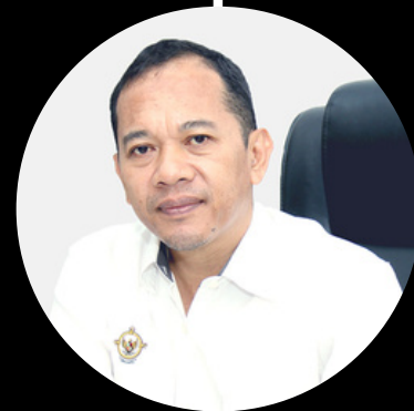
SUPERMAN, S.E., M.M., AK.CA. Kepala Subbagian Sumber Daya Manusia