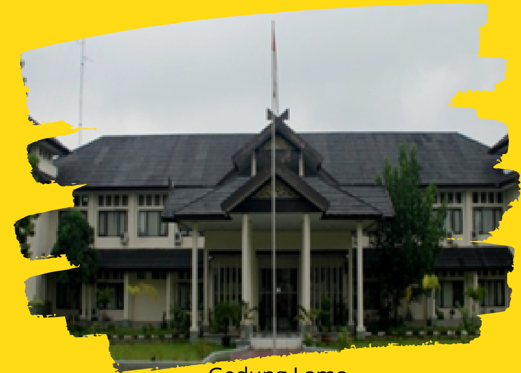
Gedung Lama Jl. Lingkar Barat I Pal 10 No.78, Jambi.