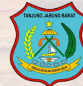
Kab. Tanjung Jabung Barat