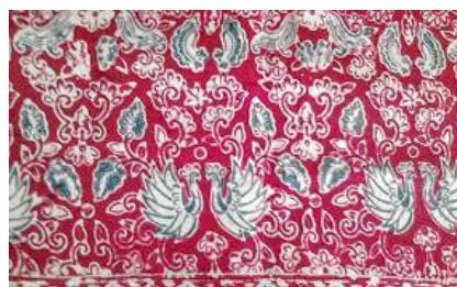
Batik Jambi Motif Angso Duo Bersayap

Motif batik Jambi sangat sederhana dan tidak berangakai (berdiri sendiri). Motifnya kecil dan lepas-lepas. Hal inilah yang menjadikan salah satu ciri khas motif batik Jambi. Penggunaan motif dalam sebidang kain selalu dikombinasikan dengan beberapa motif. Pertama-tama yang dibuat adalah motif utama, kemudian baru diisi dengan motif lainnya. Sedangkan penamaan motif kain batik yang sudah jadi mengacu kepada motif utama. Melalui sebuah motif batik, banyak hal yang dapat terungkap bagi orang yang mau memperhatikannya. Misalnya melalui motif angso duo, mungkin penciptanya ingin mengungkapkan bahwa angso dua punya sejarah tersendiri bagi masyarakat Jambi. Demikian juga dengan motif-motif lainnya yang mengungkapkan identitas masyarakat Jambi. Maka tidak mengherankan motif batik sangat penting dalam pembuatan helai-demi helai kain batik