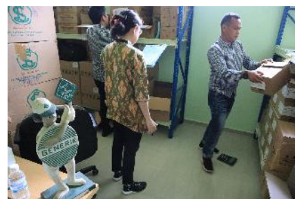
pengujian atas persediaan obat-obatan pada dinas kesehatan