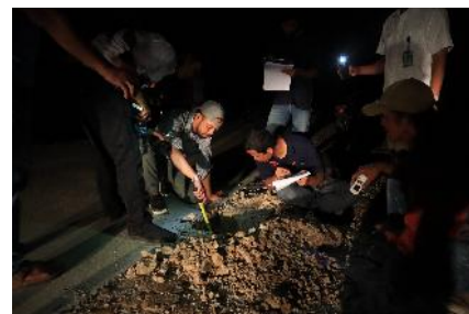
pengujian atas belanja modal pekerjaan jalan beton pada dinas pekerjaan umum hingga malam hari

Dalam pemeriksaan akun Belanja Modal, pemeriksa melakukan pemeriksaan mulai dari proses pengadaan s.d. serah terima barang/pekerjaan dan pembayaran. Pemeriksa juga agar menilai kewajaran penyajian belanja modal dan aset tetap terkait pada saat posisi per 31 Desember 2019 ( cut-off ). Pemeriksaan atas akun Belanja Barang dan Jasa diprioritaskan untuk akun yang memerlukan waktu pemeriksaan relatif lama, contohnya belanja perjalanan dinas, pengadaan persediaan obat-obatan, pengadaan bahan bakar minyak, belanja pemeliharaan dan pengadaan barang untuk diserahkan ke pihak ketiga/masyarakat. Pemeriksaan keuangan berpedoman pada Pedoman Manajemen Pemeriksaan Tahun 2015 dan Petunjuk Pelaksanaan Pemeriksaan Keuangan Tahun 2014 mulai dari tahap perencanaan, pelaksanaan, dan pelaporan pemeriksaan.