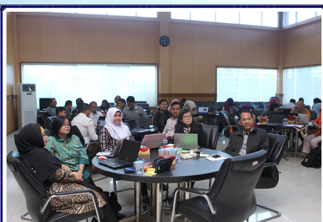
Knowledge Transfer Forum tentang Kualitas Pemeriksaan, Isu dan Tantangan terkait Kontrol, kompetensi dan Kekompakan Tim Pemeriksa