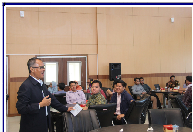
Sosialisasi SPKN Tahun 2017