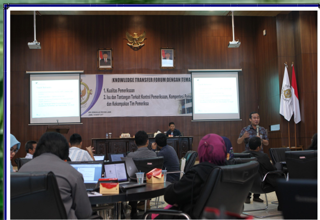
Knowledge Transfer Forum tentang Kualitas Pemeriksaan, Isu dan Tantangan terkait Kontrol, kompetensi dan Kekompakan Tim Pemeriksa