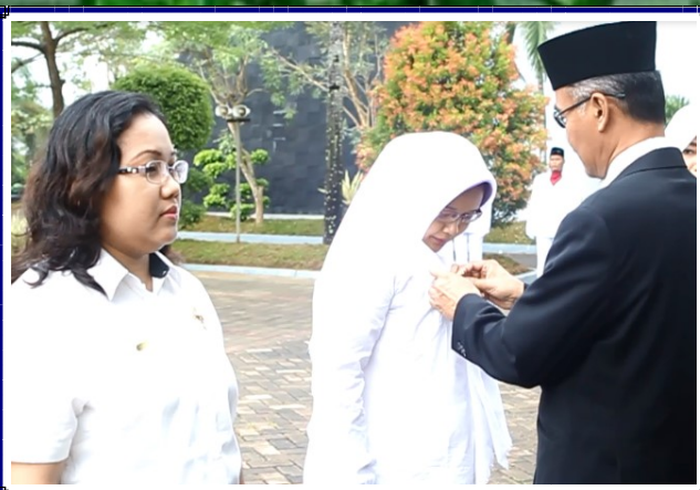
Penganugerahan Tanda Kehormatan Sayta Lancana Karya Satya X Tahun