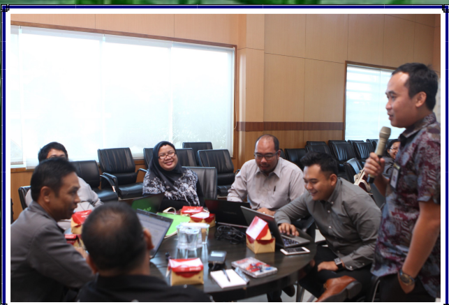
Knowledge Transfer Forum tentang Kualitas Pemeriksaan, Isu dan Tantangan terkait Kontrol, kompetensi dan Kekompakan Tim Pemeriksa