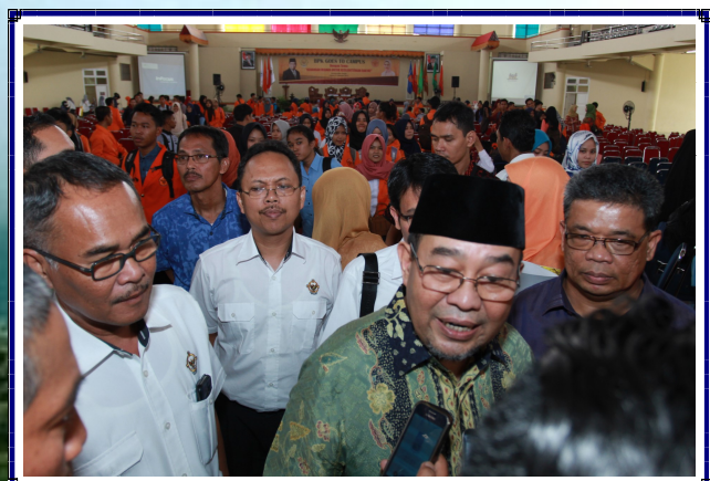
BPK Goes to Campus di Universitas Jambi