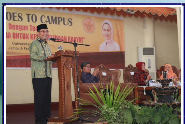
BPK Goes to Campus di Universitas Jambi