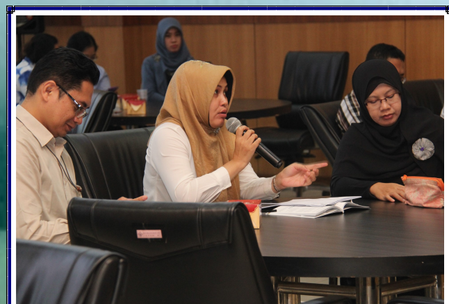
Sosialisasi SPKN Tahun 2017