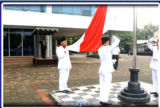
Upacara Peringatan HUT BPK Ke-70