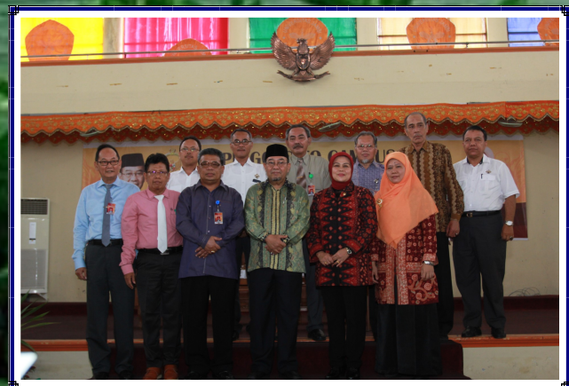
Penyerahan Cenderamata Rektor Universitas Jambi Kepada Ketua BPK