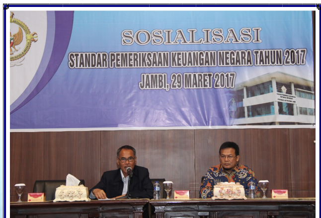
Sosialisasi SPKN Tahun 2017