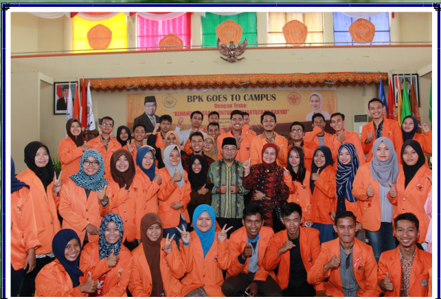
Penyerahan Cenderamata Rektor Universitas Jambi Kepada Anggota DPR RI