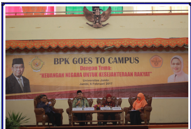
Foto Bersama Ketua BPK, Anggota DPR RI dan Pejabat Struktural BPK Perwakilan Provinsi Jambi dengan Jajaran Rektorat UNJA