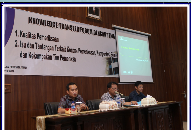
Knowledge Transfer Forum tentang Kualitas Pemeriksaan, Isu dan Tantangan terkait Kontrol, kompetensi dan Kekompakan Tim Pemeriksa