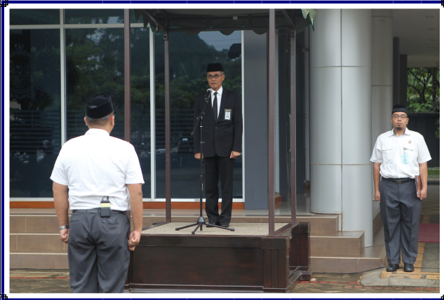
Upacara Peringatan HUT BPK Ke-70