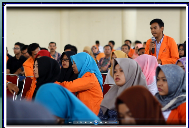
BPK Goes to Campus di Universitas Jambi