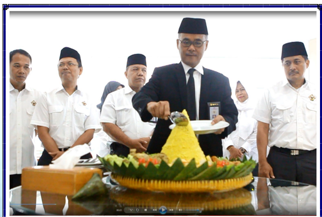
Foto Syukuran HUT BPK Ke 70