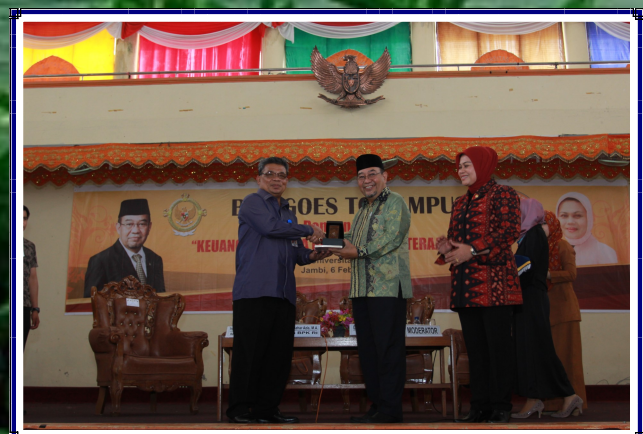
Penyerahan Cenderamata Rektor Universitas Jambi Kepada Ketua BPK