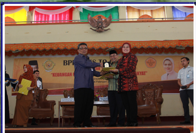
Penyerahan Cenderamata Rektor Universitas Jambi Kepada Anggota DPR RI