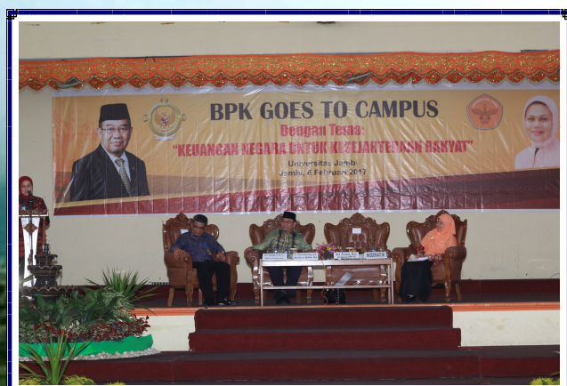
BPK Goes to Campus di Universitas Jambi