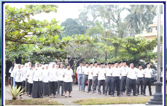
Upacara Peringatan HUT BPK Ke-70