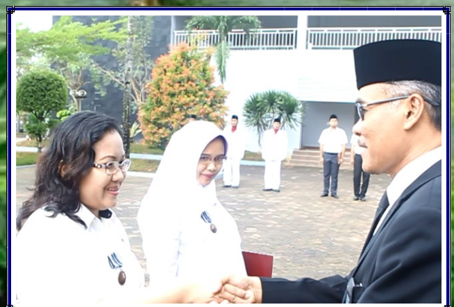
Penganugerahan Tanda Kehormatan Sayta Lancana Karya Satya X Tahun