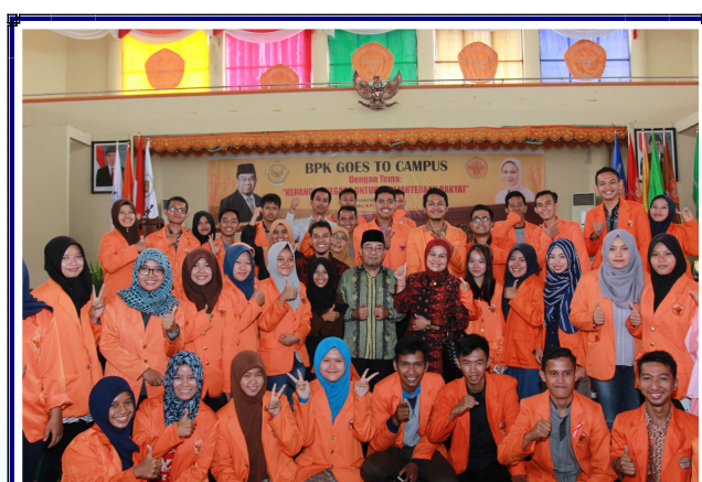
Foto Bersama Ketua BPK, Anggota DPR RI dengan Mahasiswa/i Universitas Jambi