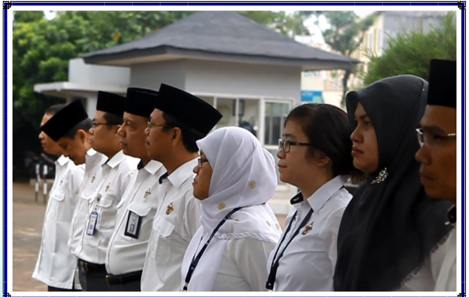
Upacara Peringatan HUT BPK Ke-70