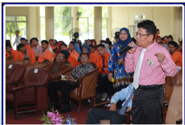
Foto Syukuran HUT BPK Ke 70