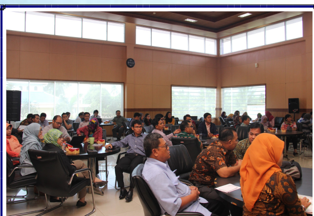
Sosialisasi SPKN Tahun 2017