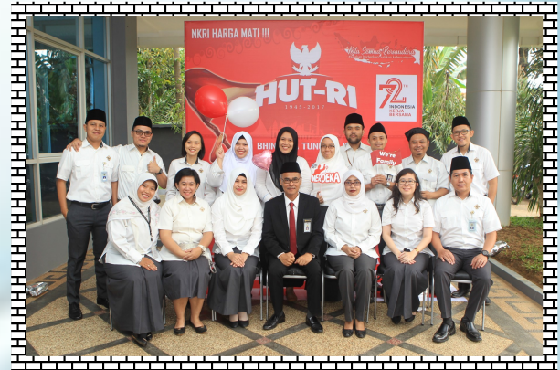
Subauditorat Jambi II