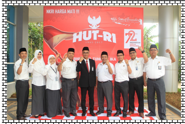
Foto bersama para pejabat struktural setelah upacara HUT RI Ke-72