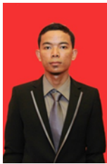
Eko Gemini / 25 Agustus