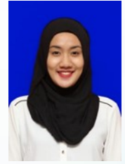
F. Ainasukma / 20 Agustus