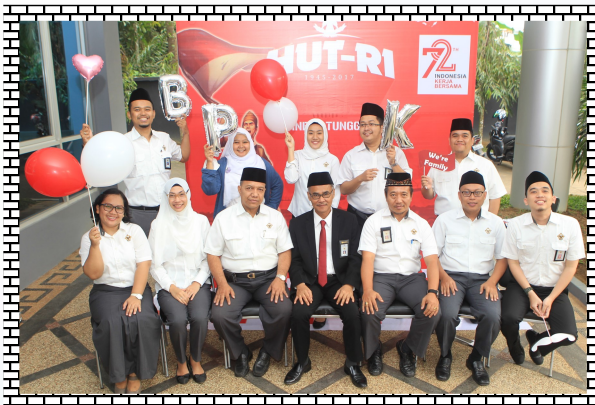
Subauditorat Jambi I