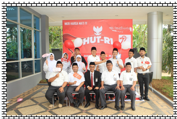
Tim Subbagian Umum dan Teknologi Informasi