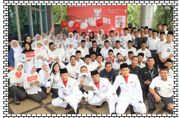
We are Family, BPK Jambi....