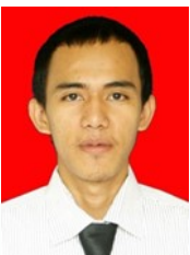
Syahrain / 2 September